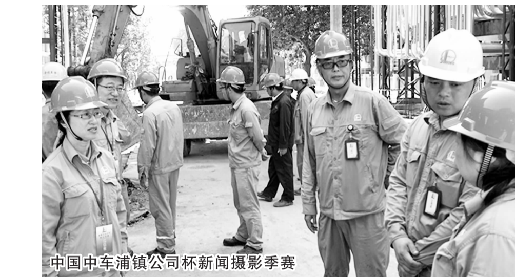
中国中车浦镇公司杯新闻摄影季赛

1、有一只壁虎沿着10米深的井往上爬,白天向上爬5米,到夜里往下滑了3米,那么壁虎什么时候可以爬出井口? 答案与解析: 壁虎白天爬上了5米,晚上又滑下了3米,那实际上每天只能爬上去2米,爬前6米壁虎用了3天,还剩4米,因此第4天就可以爬出去了。 2、往一只篮子里放鸡蛋,假定篮子内的鸡蛋数目每分钟增加1倍,4分钟后篮子就满了,请问在什么时候是半篮子鸡蛋? 答案与解析: 这一题关键是抓住条件:“每分钟增加1倍”。也就是说4分钟时篮子里的鸡蛋是3分钟时篮子里鸡蛋