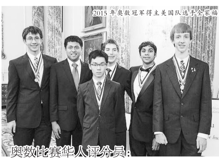
2015年奥数冠军得主美国队选手全家福。奥数比赛华人评分员。

学校里有两个“快班”——这20多名学生中,他谦虚地说“有几个还是不错的”。事实上,这所中学几乎每年都可以为美国奥数国家队或者预选赛输送一到两名学员。在国际奥数世界名人的列表中,排位前50名的华人里有5位都曾师从冯祖名,其中包括第一名、加拿大籍华人宋卓群。