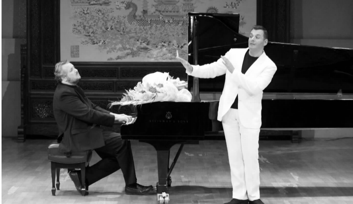
意大利普耶克二重奏音乐会上周末奏响南京文化艺术中心,钢琴的琴键在茂里茨奥·莫莱蒂手指魔术般的指挥下发出令人窒息的美妙声音。而展卢卡独特的嗓音同样迷醉了观众的心,两人联袂为观众表演了弗朗西的《爱的小径》舒伯特的《小夜曲》果里·沃尔夫的《旋律》等曲目。