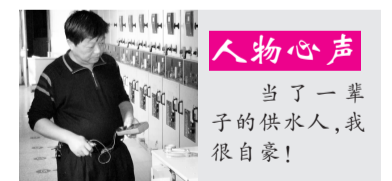
人物心声 当了一辈子的供水人,我很自豪!

开,他就爬墙入厂,组织工人打开变电所门窗,消散浓烟。随后,他打电话向公司领导汇报,请求兄弟水厂增加水压,并带着值班电工查找故障范围。