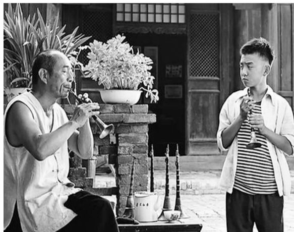
电影《百鸟朝凤》剧照

《百鸟朝凤》,是一部有情怀的影片,正如我未观影之前的判断。我料想这样有情怀的文艺影片没有商业影片与国外大片的上座率高,然而我想错了,100人左右的影厅座无虚席,而且绝大多数观众还是年轻人。