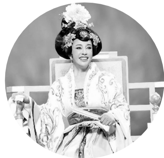
刘晓庆主演话剧《武则天》的剧照

由刘晓庆领衔主演的大型传奇历史话剧《武则天》将来到江苏巡演,其中将于9月份在扬州大剧院演出。刘晓庆在电视剧中曾经扮演的一代女皇武则天,给观众留下了深刻印象,此次她首次挑战在舞台上扮演武则天,令人期待。