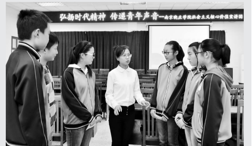
南京晓庄学院马克思主义学院大学生宣讲团最近走进南京东外外国语学校、南京市江宁上元中学,通过有趣的古今故事和身边的榜样事迹,向同学们阐述社会主义核心价值观的深刻内涵和践行方式。 陈星