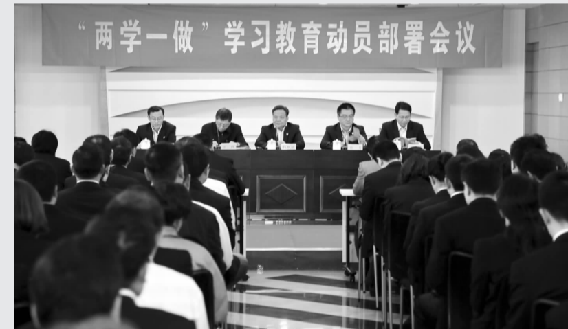
近日,南京禄口机场举行“两学一做”学习教育动员部署会议,传达学习习近平总书记关于“两学一做”学习教育的重要指示,号召机场各级党组织从严从实开展“两学一做”学习教育,真学实做凝聚建设一流国际机场强大合力。 张艳

当代中国正经历着我国历史上最为广泛而深刻的社会变革,也正在进行着人类历史上最为宏大而独特的实践创新。“这是一个需要理论而且一定能够产生理论的时代,这是一个需要思想而且一定能够产生思想的时代。”我们期待广大哲学社会科学工作者与时代共奋进、与人民同呼吸,书写中国特色社会主义新篇章,用思想和理论的力量奋力推进民族复兴的伟大事业。 据新华社电