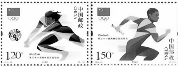
中国邮政发行的《第三十一届奥林匹克运动会》纪念邮票

动会在北京隆重举行。开幕式当天，我国发行J18《第二十九届奥林匹克运动会开幕纪念》邮票一套1枚。图案展现的是在国家体育场鸟巢中，飘逸出一幅象征北京奥运开幕式舞台的山水画。同时还发行了J18《第二十九届奥林匹克运动项目》邮票小全张和J19《北京2008年奥林匹克博览会开幕纪念》邮票一套2枚，小型张1枚。