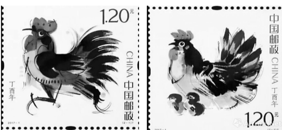
韩美林设计的《丁酉年》鸡票

韩美林表示:“能够多次参与生肖邮票的设计,我感觉这是一种缘分,也是民族传统文化与邮票艺术的缘分。”据悉,《丁酉年》鸡票将于2017年1月5日正式发行。 雯泽