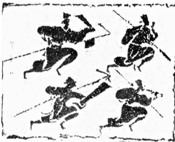
汉代画像石中的长跑训练图案

当年对于孔子,“人皆谓之‘长人’,而异之。”因此,孔子如果参加篮球运动还有着身高的优势。司马迁曾在《史记·孔子世家》中描写道,孔子身高“九尺有六寸”,他的高度相当于2米22,仅比篮球冠军姚明的身高矮4厘米。 京文