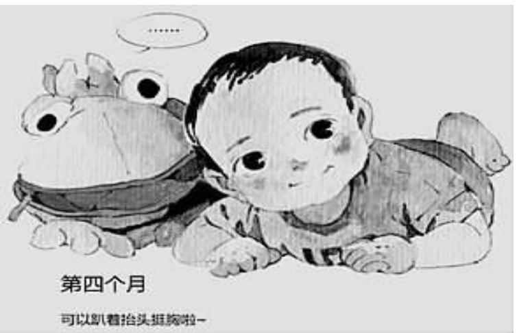
第四个月 可以趴着抬头挺胸啦~