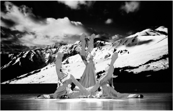
日前,武进区总工会举办的武进区第五届职工歌手大赛决赛在凤凰谷大剧院举行,16位选手参加决赛。来自常州幼儿师范学校的张展瑞以一首创作歌曲《阳光路上》获得一等奖。