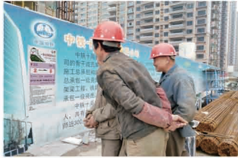
“冬日暖阳——服务劳务工人返乡返岗”志愿者活动

夯实基层团建，提升青年素质，让“青”字号工程为团旗增光添彩，让青年勇做弄潮儿、建功新时代，中铁十局五公司一直在路上！