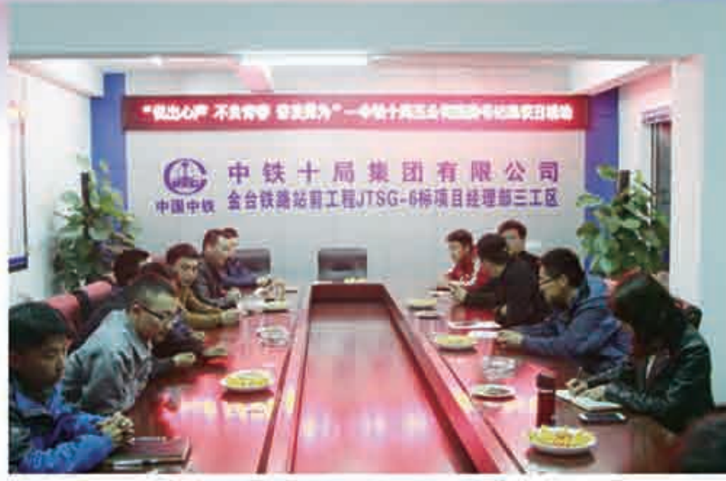
“走进青年——团委书记恳谈日”活动

强化青年安全责任。安全生产，是施工企业赖以生存的基本保障。公司团委积极抓好青年安全生产工作，在所属各项目一线成立青年安全监督岗，与青年签定安全包保责任书，以青工安全教育和工地有形化建设为主要内容，动员青年主动投身基层一线建功立业，组织青年在重点工程、重大项目、自然灾害、突发事件等急难险重任务面前，充分发挥突击队作用。以每年的“安全生产月”为契机，要求每个项目团支部开展一次以“提出一条安全建议、查找一处安全隐患、总结一个安全经验、编制一条安