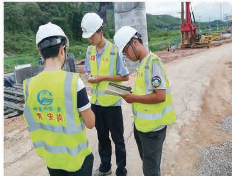
活动在施工现场一线的“青安岗”