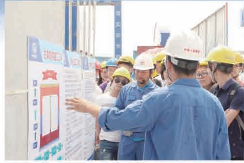
淮海大学师生观摩苏州轨道5号线项目部

全寄语、组织一场安全团课”为主要内容的安全合理化建议征集活动。通过对团员青年的安全形势教育，在青年中树立“人人都是安全员、岗岗都是安全岗、天天都是安全日”的安全理念，为促进企业安全生产形势稳定贡献力量。