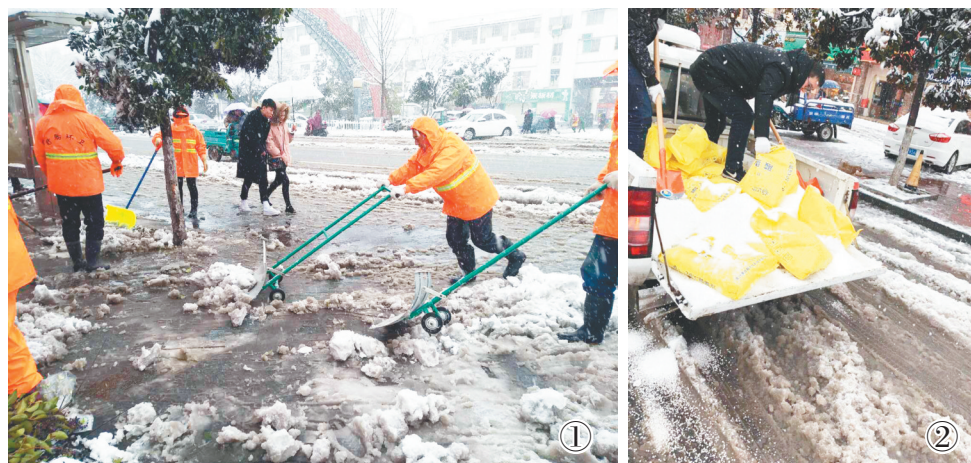
图①:盱眙县城管局环卫工人在路面扫雪