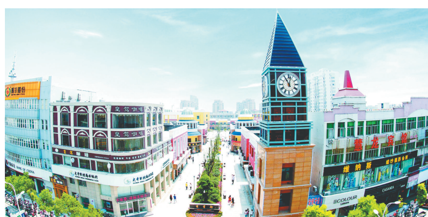
图为鸿基汇金购物公园