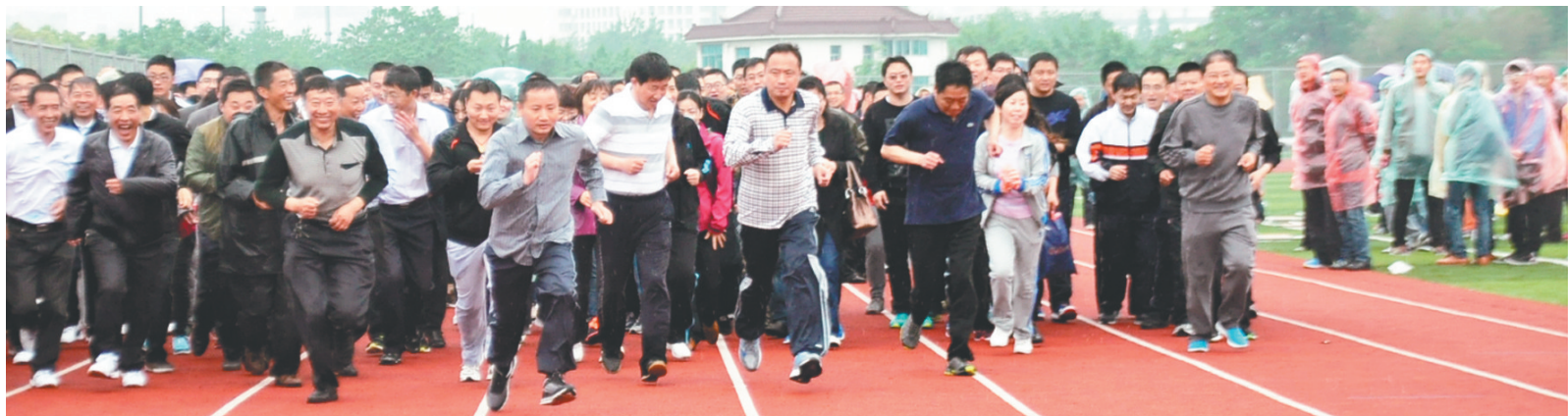
姜堰区总工会举办职工千人长跑比赛

泰州市姜堰区工会第十六次代表大会以来,全面贯彻区委和上级工会决策部署,大力开展“建功立业、素质提升、和谐创建、固本强基”四大工程,为姜堰“全面建成小康、全力争先赶超”作出积极贡献,谱写了姜堰工会工作新篇章。