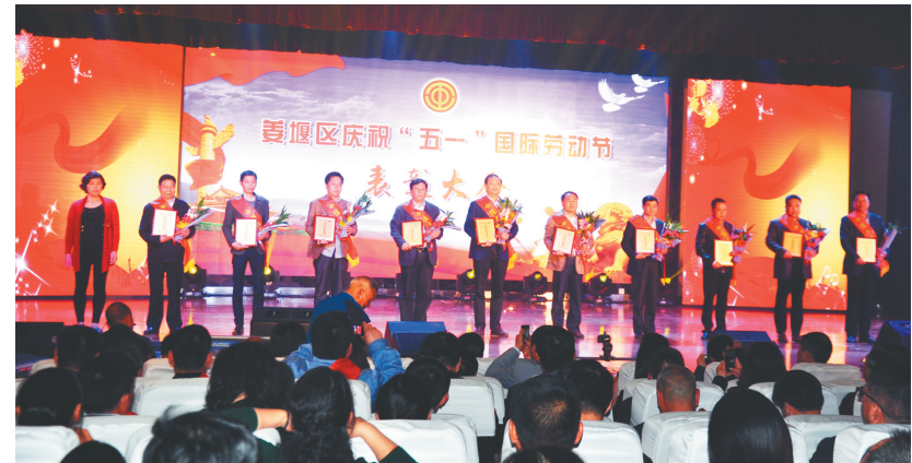
表彰“十佳关爱职工企业家、十佳工会干部和十佳职工”