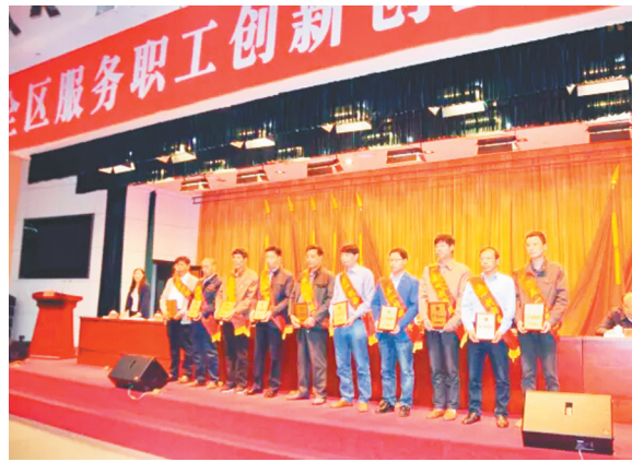
姜堰区创新创业工作推进会,表彰“十佳”创新能手和创业标兵

基础工作统筹发展。开通区总官方微博、微信,开设“书香工会·365阅读空间”“工匠风采”等“微专栏”,形成具有工会特色的“微服务”。与区广电台、报社合作,开辟工会之窗、匠心筑梦、职工风采等专题专栏,有效提升工会形