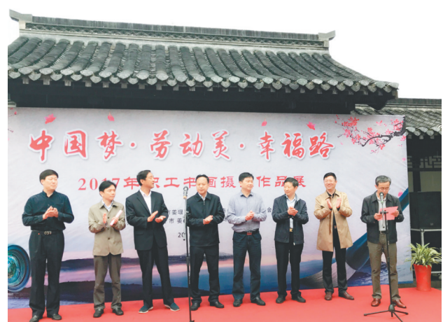
“中国梦·劳动美·幸福路”职工书画摄影展