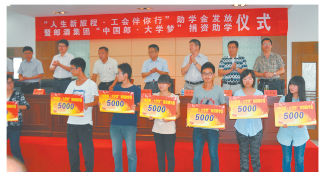
开展“金秋助学”活动