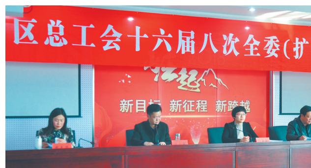
姜堰区总工会召开十六届八次全委(扩大)会