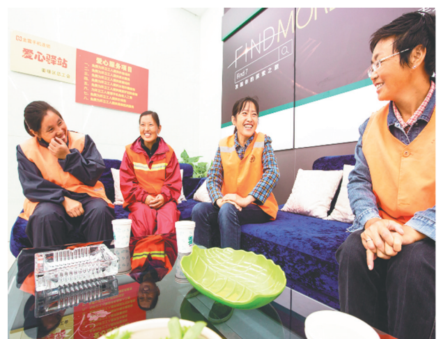
环卫工人在“安康驿站”歇脚点喝茶聊天