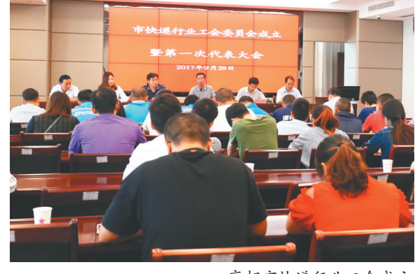
高邮市快递行业工会成立