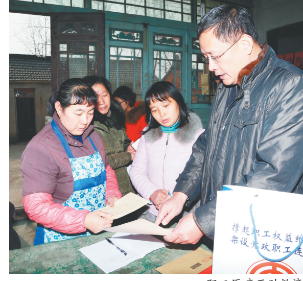
职工医疗互助救济