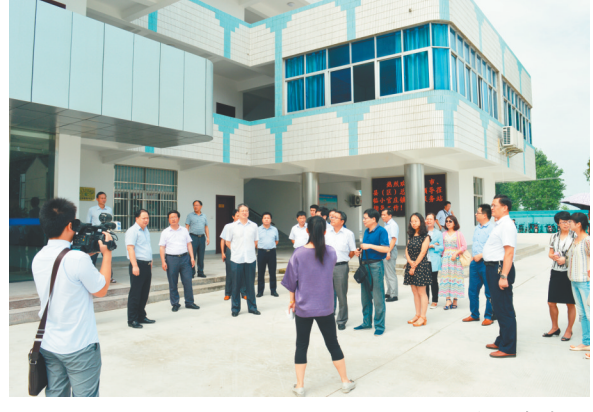
职工后勤服务中心