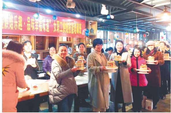
高邮市总举办女工烘焙培训