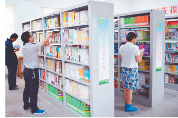
职工书屋助力职工圆梦

评。随着社会的发展,我县出租车司机、值班民警、快递员等长期在户外工作的人员数量日益增多,从2017年开始,我县一方面将“安康驿站”升级为“爱心驿站”,另一方面与银行、供电等公共服务窗口单位对接,为环卫工人、出租车司机、值班民警、快递员等户外工作人员提供休息场所15处,城区已形成户外工作人员工间休息“15分钟服务圈”。各镇区也结合自身实际,积极建设镇级爱心驿站,目前已建成14家。 爱心母婴室建设强势推进 按照扬州市总的统一部署,我县把“爱心母婴室”创建工作列为工会重点工作进行推进,力求把爱心母婴室打造成一个为女职工分忧解难、维护女职工特殊权益的阵地。目前,宝应女职工较多的单位,已建成爱心母婴室12个,其中5个获市总命名。按照有固定场所、有统一标识、有硬件设施、有宣传册的“四有要求”,建设爱心母婴室,按照有专人管理、专人服务,以及有管理制度的要求,规范管理“爱心母婴室”,精心为备孕、怀孕期和哺乳期的女职工打造一个特殊关爱的场所,有效发挥“爱心母婴室”关心女职工、促进社会和谐发展的独特作用。 职工书屋、职工文化活动助推职工素质提升 有序推进职工书屋建设,每年命名宝应县职工书屋20家,宝胜集团、供电公司等4家职工书屋获全国职工书屋称号。广泛开展“书香企业”创建活动。开展职工读书活动,每年举办职工读书月,开展职工读书征文、演讲、竞赛等活动。文化筑梦,打造职工文化品牌,承办宝应县第十三届运动会职工部比赛。联合县文体广新局开展“太极拳进企业”活动,开展篮球、足球、乒乓球、羽毛球联赛。联合县卫计委开展“万步有约”活动。在全县20家企业推广实施职工体育锻炼达标测试项目,引导职工树立强身健体意识。举办庆“五一”、“十一”系列职工文艺汇演。 职工医疗互助救济会影响日益扩大 健全职工互助保障制度,宝应县职工医疗互助救济会影响日益扩大,社会效益显著。截至目前,宝应县职工医疗互助救济会已进行六轮,入会会员近4万人,每轮大病救助支出达200多万元,职工的人面会、救济补助金额逐年增加。2018年,第七轮宝应县职工互助救济会工作,被县政府列入民生幸福工程实事项目。 在以实事工程引领普惠职工服务工作中,宝应县总一是不断新增和拓展服务职工的项目。从慰问高温坚持生产的职工到组织一线职工疗休养,从组织女职工体检到组织全体职工体检,普惠职工面越来越大;二是不断加大实事工程资金投入。近年来,宝应县总每年投入不少于30万元资金,用于职工服务平台等服务职工实事工程建设。此外,宝应县总还通过项目资助等方式,推动基层工会实施普惠职工服务项目,有效拉动各方投入,形成合力。