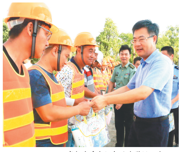
高邮市委书记勾凤诚慰问一线职工

工反映最强烈的问题入手,对症下药,标本兼治。主动探索推进工会工作体制、运作模式、工作方法、机制改革。二是突出创新重点。围绕“走特色发展之路”的要求,鼓励基层工会创新创优,开展创新创优项目评比活动,实施“一镇一品”“一局一品”精品项目培育和展示工程,不断凸显示范引领效应。 坚持三个原则。 一是坚持党的领导。自觉坚持党对工会工作的领导,保持工会工作的正确政治方向,在思想上政治上行动上始终同以习近平同志为核心的党中央保持高度一致,把党的意志和主张转化为职工群众的自觉行动,把党对职工群众的关怀落实到工会各项工作中去。二是坚持服务发展大局。围绕全市经济社会发展大局和重点工作时间节点,充分激发广大职工的劳动热情和创造潜能,实施职工素质建设工程,培育更多的“秦邮工匠”。三是坚持职工群众中心。把职工群众对美好生活的向往作为工会的奋斗目标,精确把握,主动靠前,不断提高工会工作的水平和服务质量,以工会的“高质量”服务满足职工群众的新期盼新需求。 实施四项工程。 一是强基固本工程。联合市委组织部、市非公企业及“两新”工委开展“党建带工建集中行动”,加大未建会规模企业、非公企业、幼儿园以及餐饮宾馆等服务业工会组建力度,突出抓好电子商务、物流(快递)等新产业、新业态工会组建工作。二是职工之家工程。开展基层工会“六有”示范点创建,争创“扬州市星级基层工会”。按照“会站家”一体化思路,把组建工会、创办职工服务中心、建设职工之家有机统一起来,高质量、高标准打造一批模范职工之家。三是服务平台工程。打造市镇两级职工服务平台,并实体化运作。推动成立市镇两级职工服务中心,建立市镇两级职工服务中心,在乡镇(园区)便民服务中心开设工会窗口,将职工服务平台纳入政府主导的公共服务网络,实现市镇区域联网。