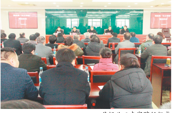
县级职工专家聘任仪式