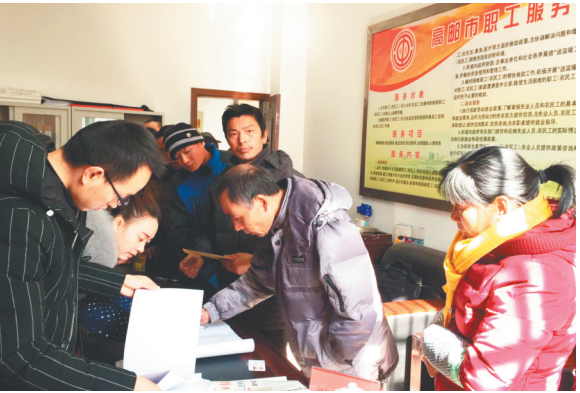
特困职工领取春节慰问金等