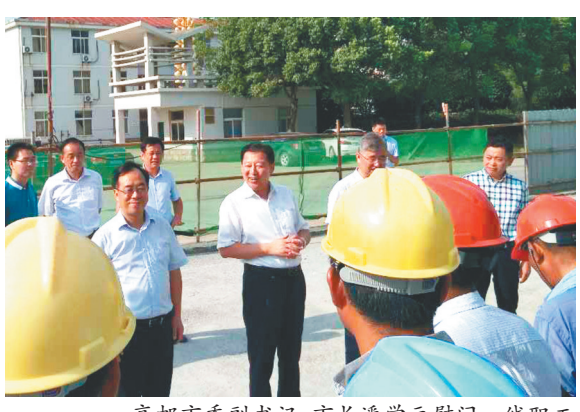
高邮市委副书记、市长潘学元慰问一线职工