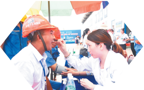
零距离服务广大职工,工会成为了职工的贴心“娘家人”。

新时代要有新气象,新使命要有新作为。让我们以党的十九大精神为指引,开拓进取、锐意创新,奋力开创新时代南京工会改革发展新局面,团结动员全市广大职工在建设“强富美高”新南京中发挥主力军作用,为全面建成小康社会、奋力谱写社会主义现代化新征程南京篇章作出新的更大贡献!