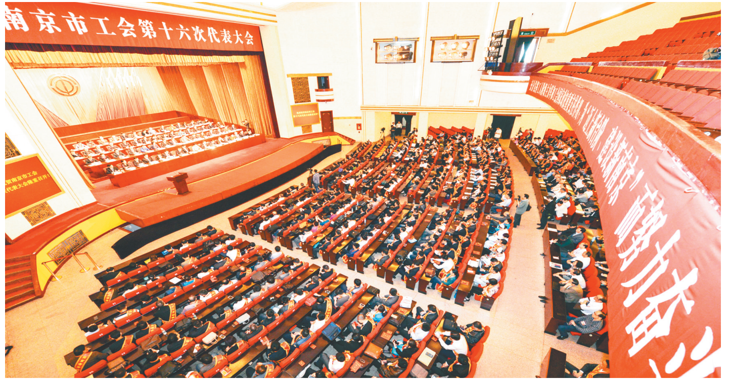
南京工会十六大开启全市工会工作新征程

党的十九大报告,着眼新时代新战略新要求,对工人阶级和工会工作作出新部署、提出新要求,为新时代工人阶级和工会工作提供了行动指南。去年以来,南京工会在市委和省总工会的坚强领导下,锐意进取、真抓实干,深入实施“五大行动”计划,聚焦聚力“四大重点”任务,扎实推进30项重点工作,团结带领广大职工为建设“强富美高”新南京作出了积极贡献。