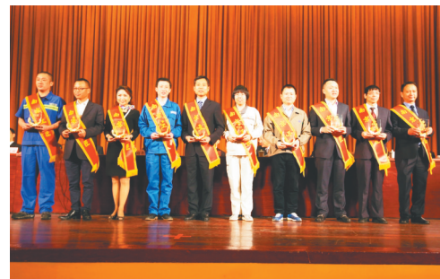
每年从10个不同行业(工种)中通过技能比武等方式选拔10名“南京工匠”,推动工匠精神在南京落地生根。

加快推进职工文化和服务阵地建设,市新工人文化宫建设项目正式奠基并实施桩基工程。发挥市职工服务中心平台作用,培训职工7093人次,安置就业3109人次,发放小额贷款4897万元,市总荣获“全省工会职工服务平台建设省级示范单位”称号。提高职工互助互济保障标准,新增会员4.2万人次,1.5万人次获得互助保障待遇2650万元。实施农民工“求学圆梦行动”,103人通过免费学历