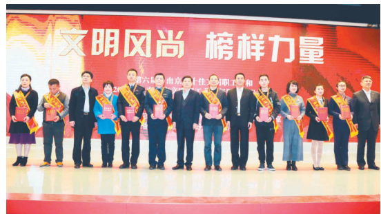
第六届南京市十佳文明职工表彰大会