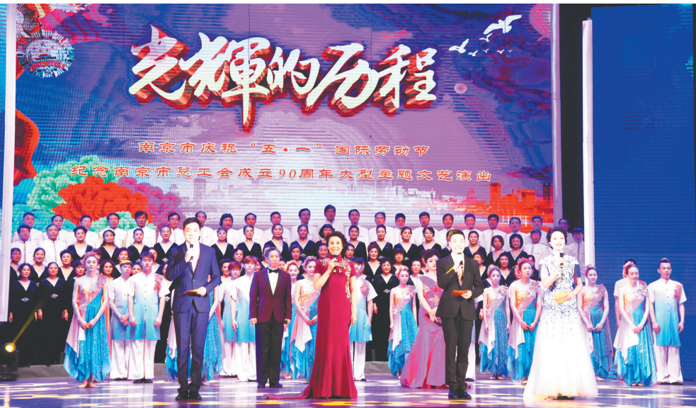
“光辉的历程”文艺演出、“铿锵峥嵘90载·继往开来谱新篇”等活动,隆重纪念市总工会成立90周年。