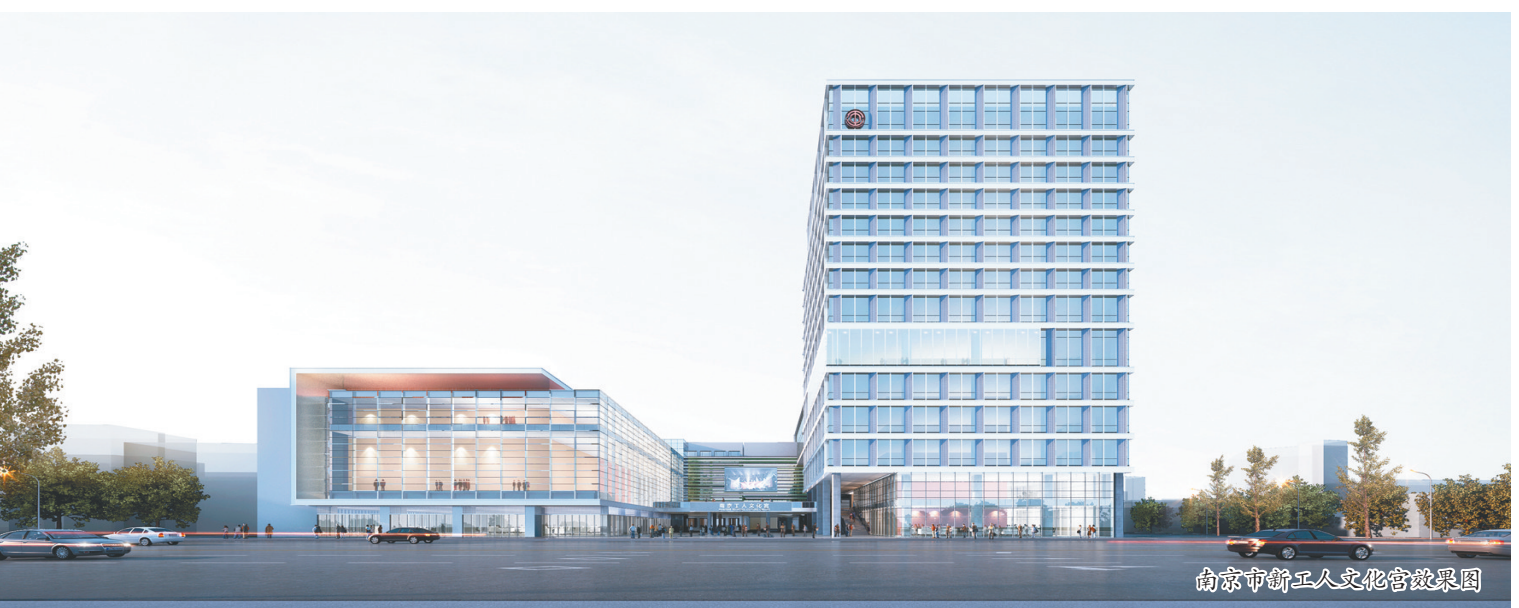
南京市新工人文化宫效果图