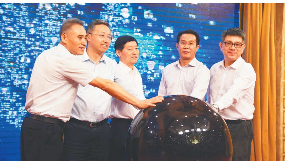
全力打造面向未来的“智慧工会”新门户,南京工会APP跻身“全国最具影响力工会客户端”。