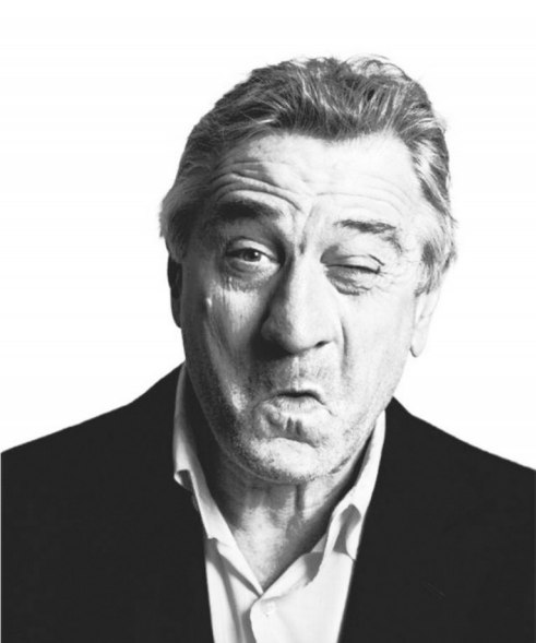
这个老头也有这么幽默的一面

2016年，73岁的罗伯特·德尼罗在喜剧《下流祖父》中出演了一个“老而弥坚”的搞笑祖父形象，让观众笑得前仰后合。虽然已是古稀之年，但从罗伯特·德尼罗身上完全看不到垂垂老矣的形象，在不少人的心目中，他还是那个40多年前“出租车司机”，还是那个“愤怒的公牛”，还是那个美国最受欢迎的演员，还是那个将演技和个人魅力结合得最完美的人。