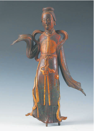
鎏金铜舞女灯座 南通博物院馆藏