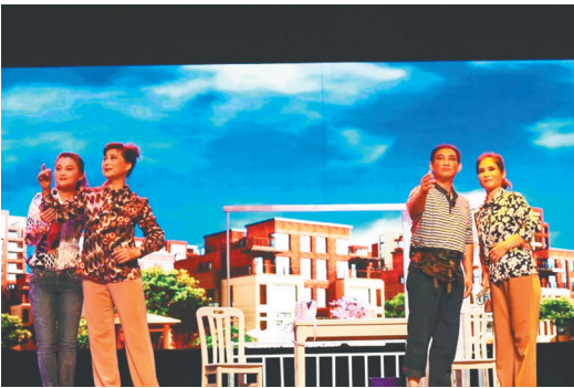
徐州梆子戏《叫你一声大姐》