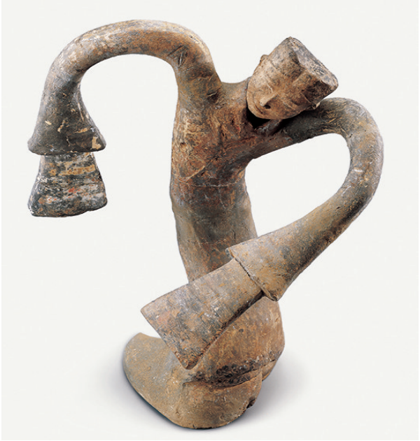
西汉绕襟衣舞陶俑 徐州博物馆馆藏

“舞”，是人类情感最强烈的表达方式之一。5月18日国际博物馆日当晚，南京博物院联合苏州博物馆、徐州博物馆、南通博物院举办“舞动一座博物馆”活动，四城四馆用超链接的方式共舞于博物馆日之夜。四大博物馆同开夜场，观众可在任意一家博物馆内看到其他三家的精彩直播，各类演出——呈现。在这次博物馆奇妙夜中，以“舞”为主题的相关文物成为焦点，公众对博物馆的热爱和情怀也在同一时刻舞动绽放。