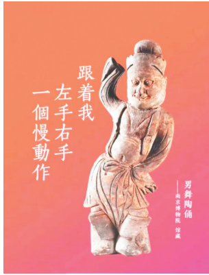
男舞陶俑 南京博物院馆藏

徐州博物馆所藏的这两种汉代舞俑，在其他地区少见出土，是西汉早期舞蹈形式及造型的实物资料，弥足珍贵。这种俑均立姿，或弯腰屈身，或呈S形，凸显长袖折腰舞长袖如瀑布飞洒，飘逸安然，舞姿呈曲肢折腰，妩媚婀娜的特点。舞俑以其高度写真和生动描绘形象地诠释了“翘袖折腰”的真谛。此类舞俑应是当时楚王宫内特定舞蹈舞者的形象，并且可以