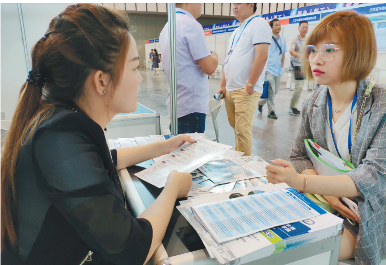
用人单位与技工院校对接洽谈

“我选择的技校专业就是自己热爱的专业。到技校后，我一定刻苦学习，把自己的所学运用好，将来像江苏的工匠大师们一