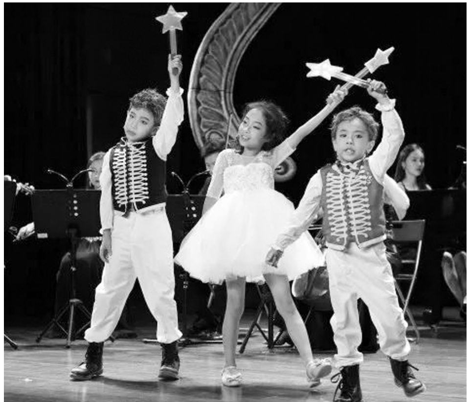
《莫扎特的魔法世界》剧照

演出单位：plus one打击乐团 地点：南京保利大剧院大剧场 时间：2018-08-08 19:30 触融未来·普乐斯万打击乐团音乐会，将打破常规的演出形式，而是用一种类似舞台剧的故事段落情节来展示整场音乐会。小朋友们将分成若干个团队，与打击乐团的老师们以舞台剧的形式进行汇报演出。