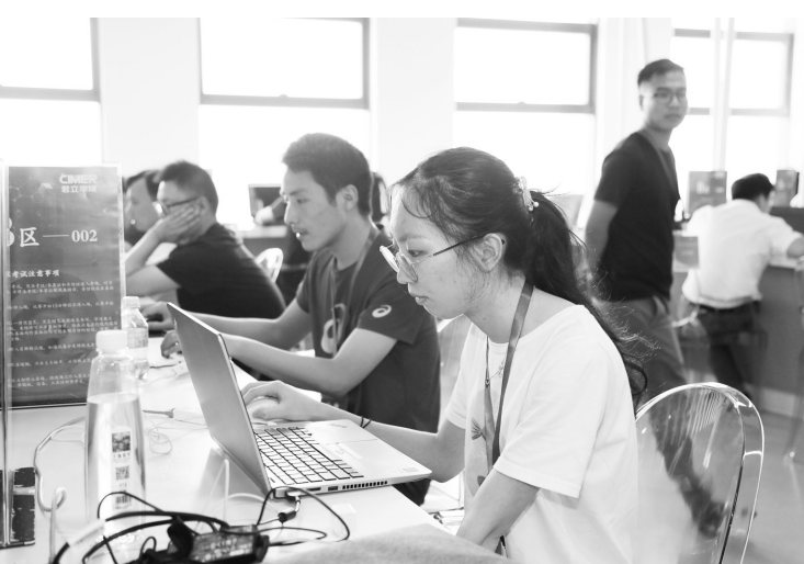
连云港社区工会暑期课堂

持职工创业资金申领细则》,明确扶持对象、项目要求及申请流程等,设立职工创业资金100万元,充分发挥创业奖励资金的杠杆作用,采取以奖代补的方式扶持带动职工创业的创业典型、创业能人、创业明星等,2017年已为20名职工创业者发放创业奖励资金10.3万元。 此外,兴化市总以孵化基地为平台,建立职工创业好联盟。市总与兴化市启萌沃土众创空间等7家单位达成合作协议,为职工提供与创业相关的咨询、指导、项目等服务和创业就业实习场所(岗位)等,组织职工创业“手拉手”联谊、沙龙、报告会,交流创业先进经验,帮助解决职工创业过程中遇到的问题。他们重点发挥“启萌沃土众创空间”创业孵化基地的示范引领作用,在为创业者提供优惠的同时,搭建商务政策对接服务、“互联网+”服务、创业导师服务、共享配套服务等平台,为职工实现创业梦想提供“练兵场”。 兴化工会还积极开展优秀创业典型宣传和优秀创业项目展示推介工作,经择优推荐和专家评审,全市确定“兴化市博汇电子商务有限公司”等19个市级优秀创业典型为“五一创业岗”,市总多方宣传展示优秀创业者的创业路径、创业秘诀、创业智慧和创新创业精神,为职工提供良好的创业导向。