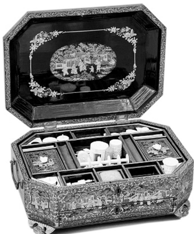
清黑漆描金人物故事长方委角套