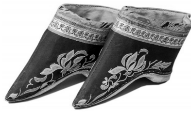
清蓝色缎锁绣花卉纹尖足鞋

近代中国,百年激荡,身处时代风雨中的新女性,在文明的洗礼中觉醒,她们走出家门,接受教育,投身社会,追求平等,这些艰难渐进的成长、点点滴滴的变革,如同涓涓细流,最终汇聚成推动新旧社会更迭的巨大洪流。女性的种种新生,不仅益于个人和家庭,最终惠及的是国家和民族。