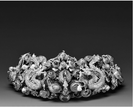
金镶宝石龙凤挑心