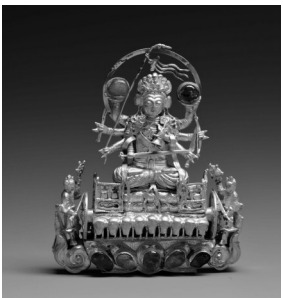
金镶宝石摩利支天簪