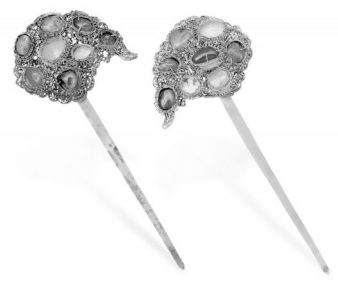
云形金累丝镶宝石簪