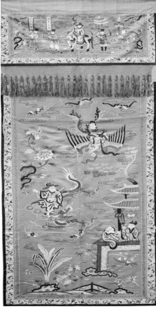
清红色缎锁吹箫引凤纹门帘