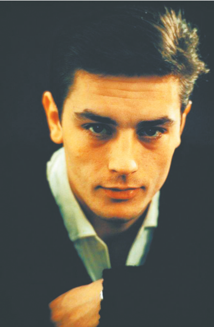
年轻时候的阿兰德龙帅得让人窒息。

如佐罗一般身骑白马,一柄长剑,除暴安良,游走江湖是多少少年曾经的梦想;那个扮演佐罗的男人阿兰德龙,雕像一样的面容,大海一样深邃的眼睛,鲜花一样迷人的微笑,更是迷倒了无数少女;可是如果你揭下佐罗的面具,会发现阿兰德龙的一生比佐罗还要精彩。