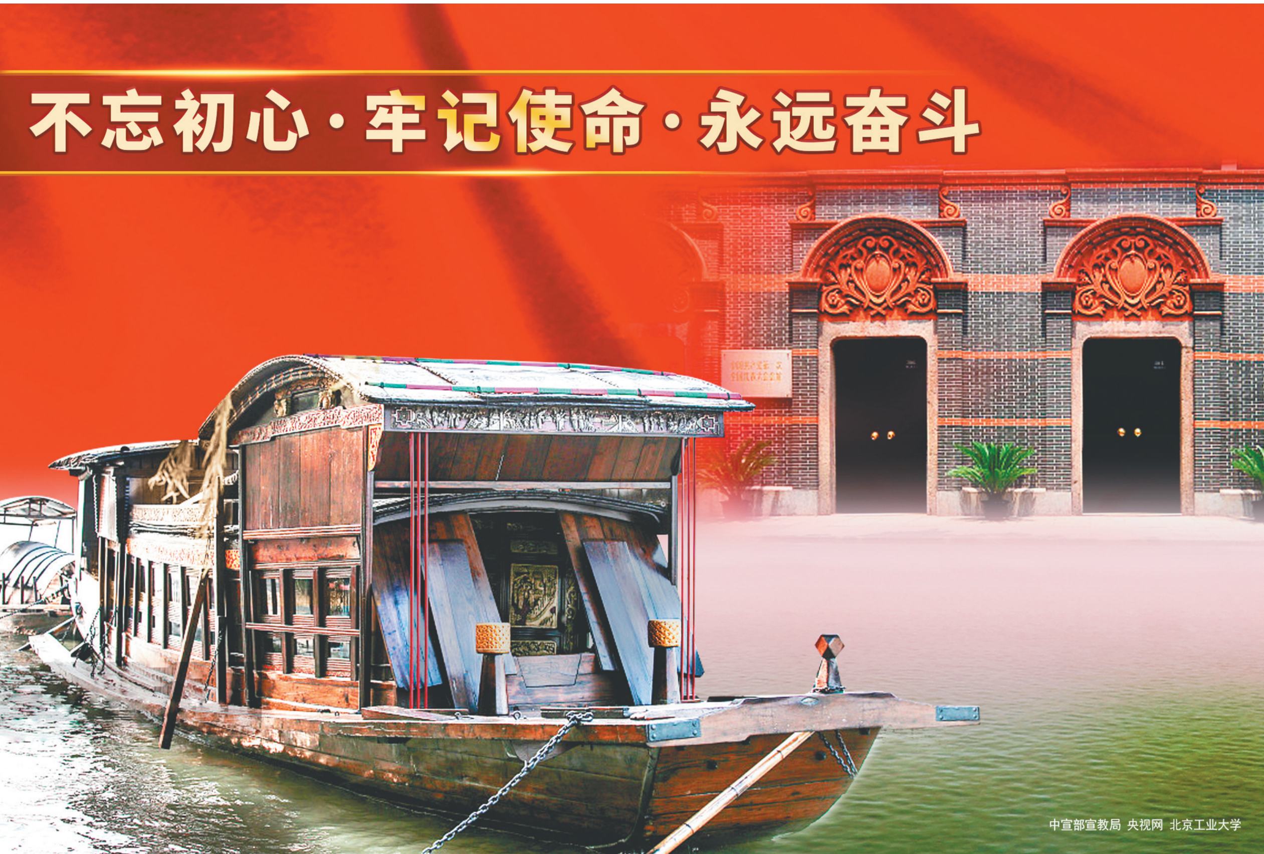
中宣部宣教局 央视网 北京工业大学