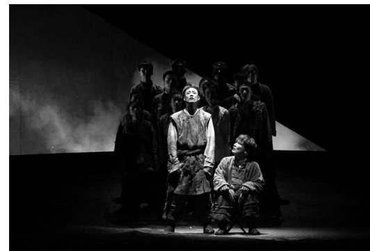
《一句顶一万句》剧照

拿到剧本的时候，我的女儿、助理都在身边，我就发给他们一块看。大家看完后，观点一致，非常牛，太牛了。”