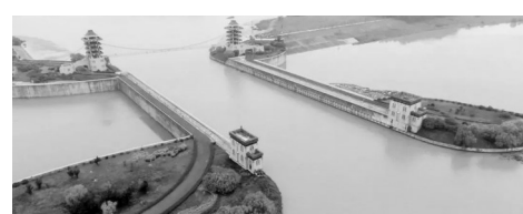
大运河-淮河入海水道立交