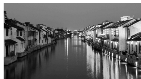
无锡清名桥古运河

“千里运河独一环。”运河无锡城区段是整个大运河上唯一抱城而过的河段。高低错落的房屋，窄窄的水弄堂，无锡环城古运河尽显一派“人家尽枕河”的水乡风貌。