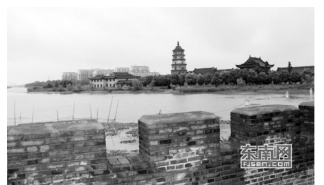
高邮明清运河故道

作为中国大运河联合申遗牵头城市的扬州号称“运河之城”，大运河扬州段共有6段河道和10个遗产点，覆盖了运河遗产的主要类型，拥有着沿线城市中最多的世界遗产点段。