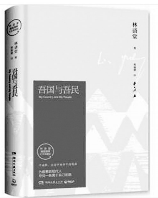
(林语堂/著 湖南文艺出版社)

电影《哪吒之魔童降世》,有太乙真人、申公豹、灵珠等元素,显然脱胎于封神榜,且是个道教设定。但哪吒在最开始,却是佛教中人。在成为这个拥有Q弹小肚皮、超浓黑眼圈的小孩之前,哪吒都经历了什么?