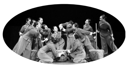
音乐剧《淮海儿女》剧照

江苏这块红色的热土,孕育诞生了雨花英烈精神、周恩来精神、新四军铁军精神、淮海战役精神、常州三杰精神等彪炳史册的革命精神,成为江苏艺术工作者开掘不尽的富矿。“最后一碗米,用来做军粮”的淮海战役,以及“百万雄师过大江”的渡江战役,在不同的艺术样式表达下,呈现出丰富多元、生动感人的精神风貌。 2018年度江苏艺术基金资助项目杂技舞台剧《渡江侦察记》、音乐剧《淮海儿女》(原名《淮海之恋》)均具有“燃爆”全场的艺术魅力。曾荣获第三届江苏省文华大奖的《渡江侦察记》作为2019南京文化艺术节闭幕演出,曾创下单场演出观众六十多次鼓掌的记录。南京市杂技团团长池文杰对此深有感触:“这部作品是国内首次以杂技舞台剧的形式来演绎渡江战役,我们创新运用了高空攀越、翻腾特技、魔术、悬荡等及地方特色的江南评弹等多种艺术形式,尽一切可能把杂技‘惊、险、特’的特点融入到立体的舞台叙事中,生动地勾勒出英雄群像,很受观众欢迎。”