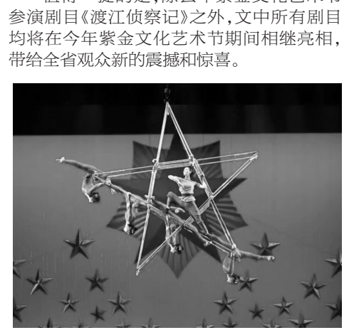
杂技舞台剧《渡江侦察记》剧照