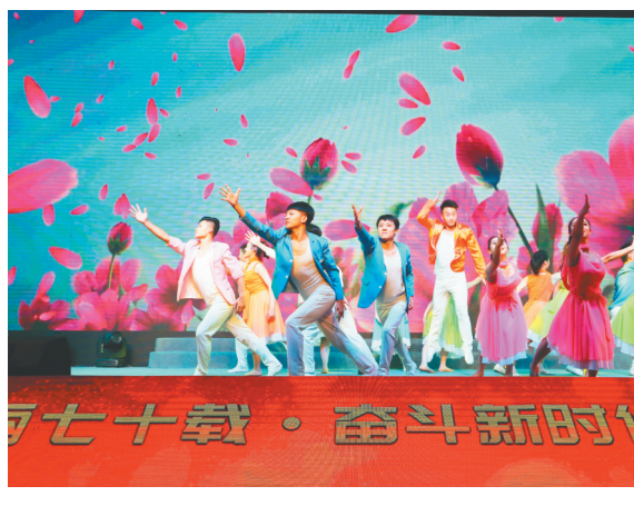
南通市物业管理协会表演民族舞“多情的篝火”。