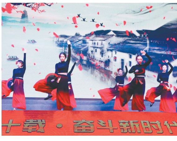
无锡市物业管理协会表演歌舞“在希望的田野上”。