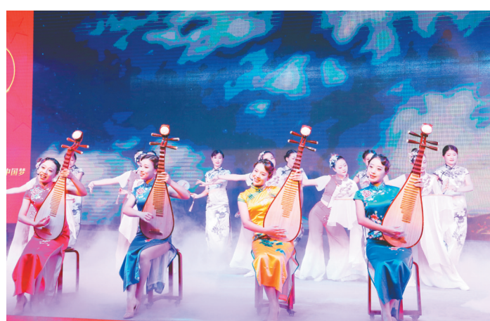
苏州市物业管理协会表演苏州评弹“苏州物业好风光”。