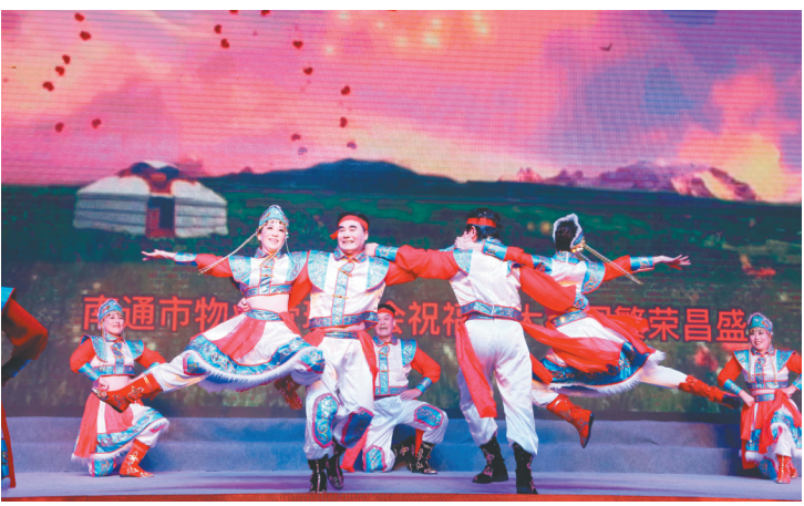
南通市房地产业协会和镇江市物业管理协会联合出演“书简舞”。