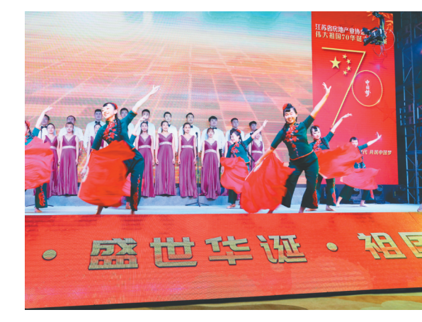
南京市物业管理行业协会表演“青春阳光”。