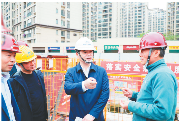
张伟局长检查指导轨道交通5号线工程轨道施工项目

在全面开展特色田园乡村试点建设上,走出了从“图上”到“地上”、从“设计”到“实践”的关键一步。经过两年的建设,该市从20个特色田园乡村试点扩展到当前的56个,同时,开展全市第三批67个被撤并镇整治和两批49个建制镇美丽城镇建设,走出一条具有地方特色、体现标杆