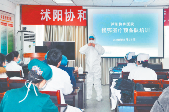
沭阳协和医院援鄂预备队在培训。