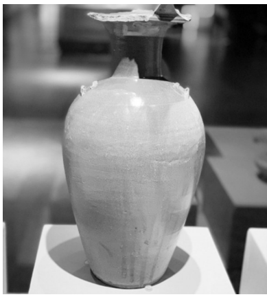
南朝的青瓷盘口壶

一只西周夹砂陶鼎,有可能将南京城的建城史提前近500年;一只东晋陶扑满、一枚铜印章、一个宋粉盒,都展示出南京老百姓千百年来生活习俗变迁;一块城砖,则展示出700年前南京砖窑领先东亚的高科技……这些千年的宝贝,都是南京市考古研究院2019年开展考古发掘项目中出土的文物。