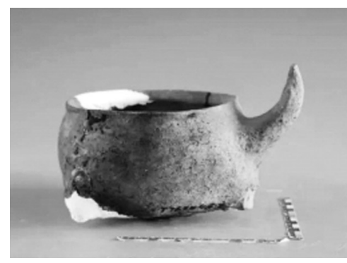
西周时期的陶角把鼎