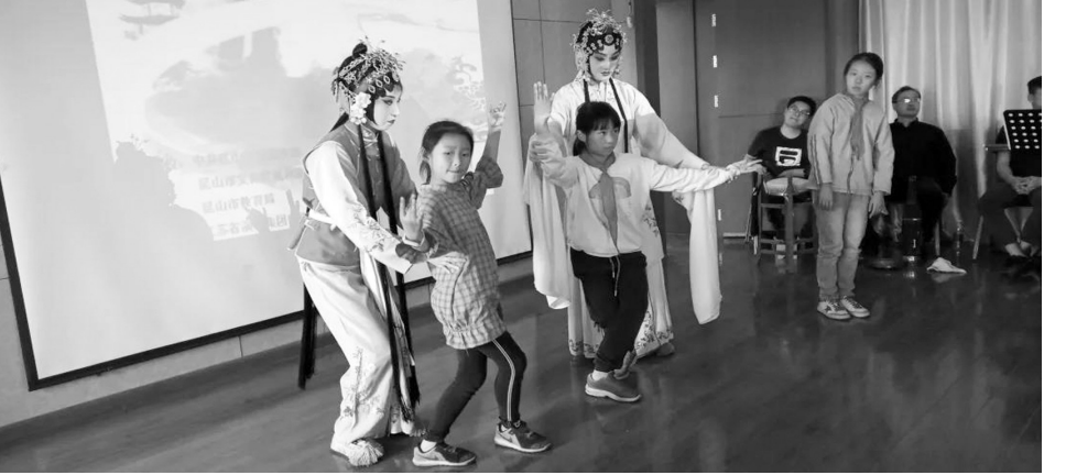
江苏省演艺集团昆剧院昆曲普及活动现场

在江苏大剧院美术馆,还为家长和孩子安排了一场“戏里风华——皮影与戏曲绘画精品展”,届时将展出江苏省美术馆馆藏皮影以及戏曲绘画100余件。有着浓郁地方色彩和强烈民族风貌的皮影,还有关良、叶浅予、傅小石、高马得等艺术家的戏曲人物作品,可以大饱眼福。