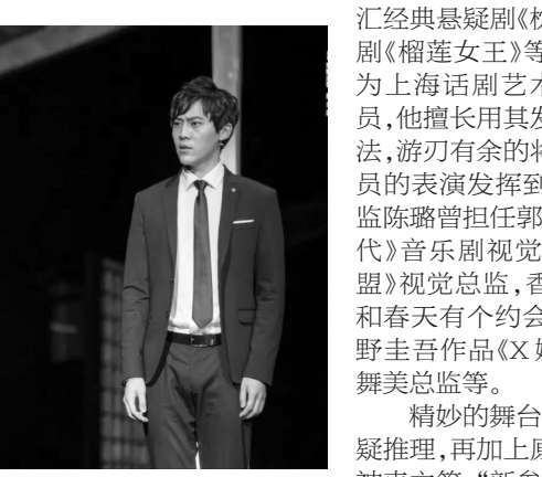
舞台剧《新参者》剧照

精妙的舞台设计,完美的悬疑推理,再加上原作东野圭吾的神来之笔,“新参者”们还在等什么?