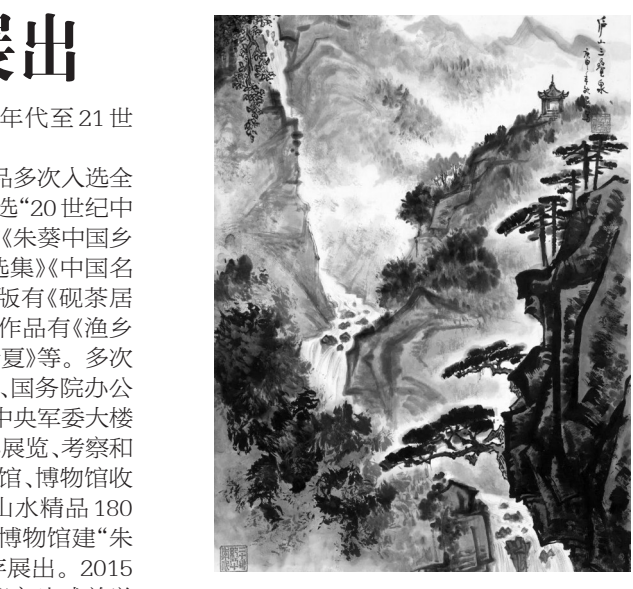
庐山三叠泉 国画 1980年

作为中国山水画家,其作品多次入选全国展览和国际展。《新雨初霁》入选“20世纪中国百年画展”,出版山水画专著《朱葵中国乡情山水画选集》《朱葵水墨画精选集》《中国画家画集——朱葵》等十多册,出版有《砚茶居谈画——朱葵美术文集》。代表作品有《渔乡清晓》《雅鲁藏布江源头》《星江清夏》等。多次应邀为北京人民大会堂、中南海、国务院办公厅、天安门城楼、毛主席纪念馆、中央军委大楼等场所作画。曾赴世界各国举办展览、考察和讲学交流,多幅作品为国外美术馆、博物馆收藏。2006年11月朱葵将自己山水精品180余幅捐赠给江西婺源,婺源博物馆建“朱葵中国画艺术馆”,将其永久保存展出。2015年7月3日“朱葵美术馆”在高邮市建成并举行开馆典礼。