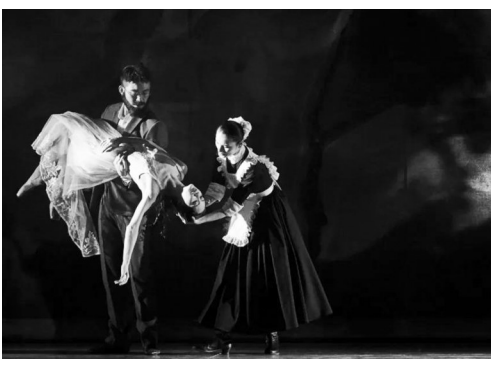
芭蕾舞剧《茶花女》剧照

今年的高考已经结束,但高考作文还一直为大家津津乐道,特别是最后一届江苏卷的作文:“同声相应,同气相求”,一如既往的“风花雪月”,一贯的江苏味道。尽管作文题目让人绞尽脑汁,但如果小说中的人物能出来答卷,那么《茶花女》中的女主角玛格丽特,或许会是最好的解答者。