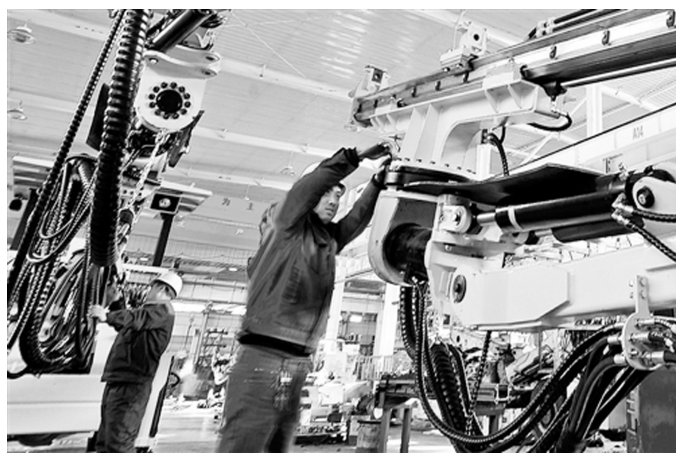
张家口市扶持中小企业转型发展作为引领高质量发展的引擎,出台“一揽子”优惠政策。