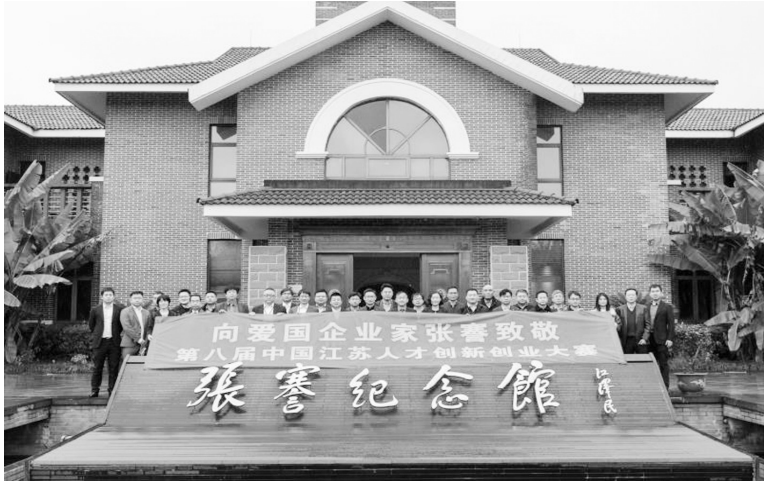
颁奖仪式前,与会集体参观张謇纪念馆。

此次大赛一大亮点是充分把握受疫情影响海外人才回流的机遇,海外选手占比超过10%,通过为他们搭建创新创业平台提高江苏的向心力、吸引力。“我们从国外回来,要敢于超过自己在欧美的导师,在创新上面不断把学科发展做到世界学术前沿。江苏对于中国就好比加州对于美国一样,我觉得