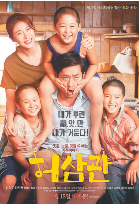
河正宇首部自导作品《许三观卖血记》。