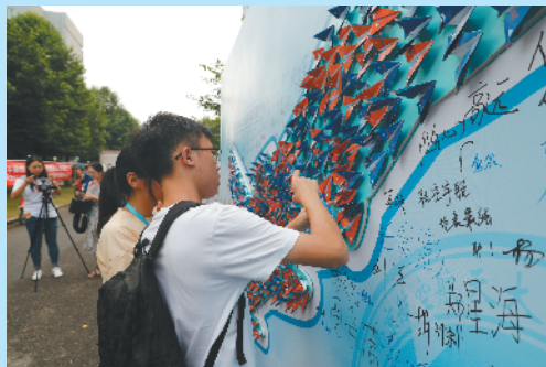
新生选取印在纸飞机上的院士和名师寄语