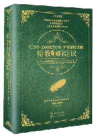
《给教师的建议》 [苏联]苏霍姆林斯基 著 长江文艺出版社