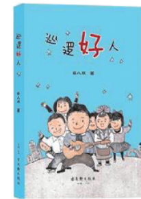
《巡逻好人》 徐人双 著 古吴轩出版社