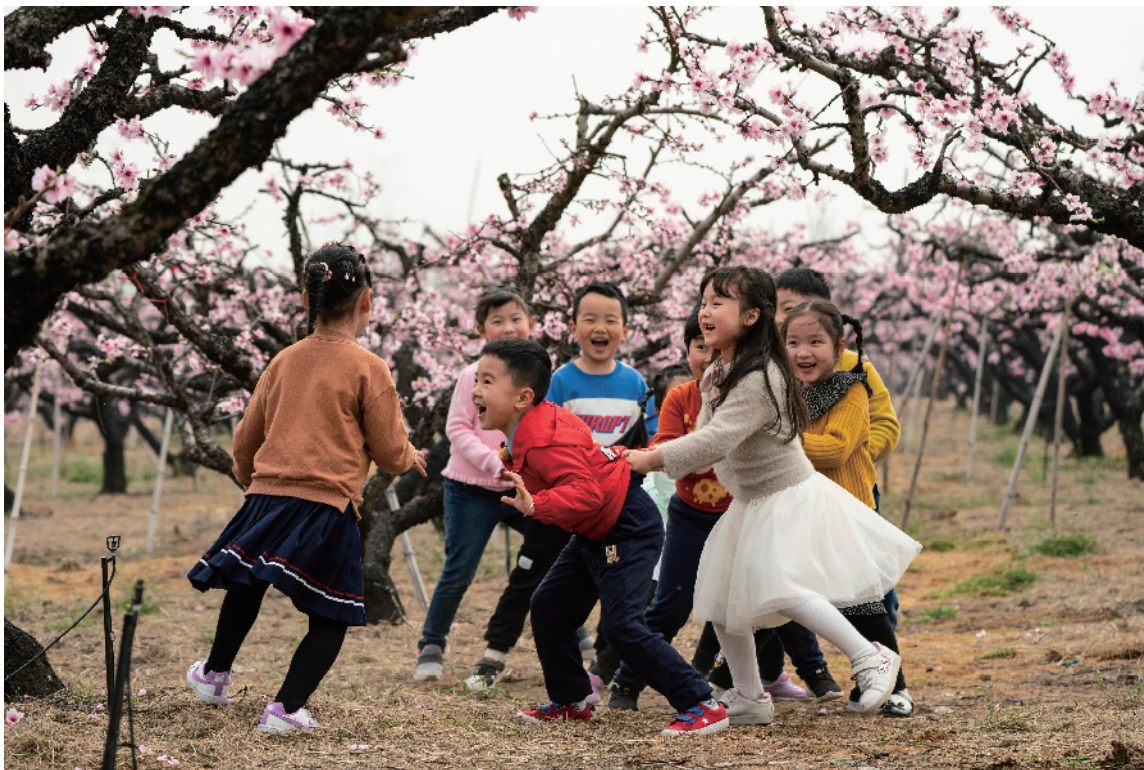
3月27日,无锡市阳山中心幼儿园把课堂搬进桃园,让孩子们零距离感受大自然的神奇和美好,培养其热爱大自然、保护生态环境的意识。图为孩子们在桃园中做游戏。

据统计,目前该市在12个镇(街道、园区)均建有校外教育辅导总站,在176个行政村(社区)建有校外教育辅导中心站,在221个自然村建有(家庭)教育辅导点。该市聘请1851名“五老”志愿者任辅导员,形成了一支以“五老”为主体、在职教师为主力、其他有一技之长的志愿者(大学生村官等)共同参与的校外教育辅导员队伍。