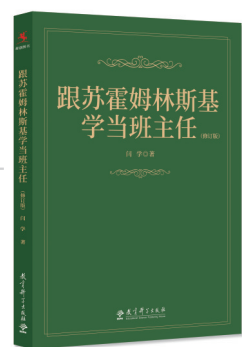
《跟苏霍姆林斯基学当班主任》 闫学 著 教育科学出版社