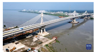
中企承建的孟加拉国帕亚拉大桥正式通车。