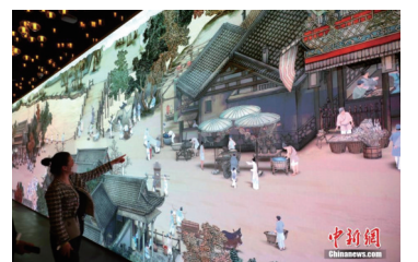
活化南京版《清明上河图》三大艺术展携手亮相南京