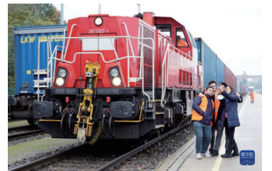
首发“上海号”中欧班列抵达德国汉堡。