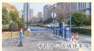
市民中心区域停车场