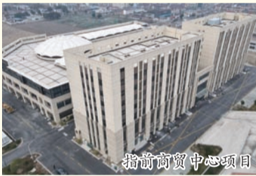
指前商贸中心项目