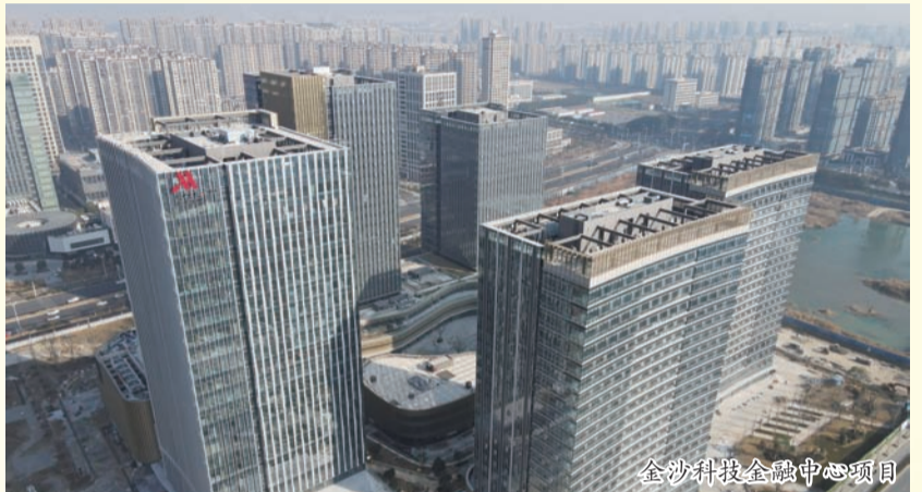
金沙科技金融中心项目