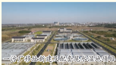
一污厂移址新建及配套尾水湿地项目