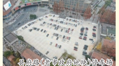
县府路(老市政府地块)停车场