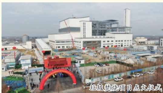
垃圾焚烧项目点火仪式