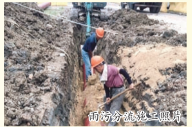
雨污分流施工照片