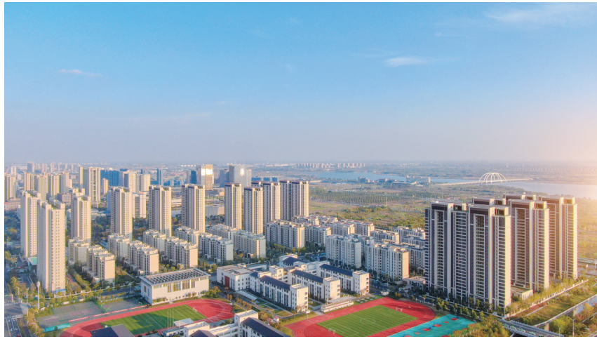
金坛不断提升开放质量和水平,更高层次融入长三角一体化发展。

区委十四届二次全会提出,要充分发挥城市开发建设管理委员会作用,有效克服空间割裂、规划打架、功能碎片化等突出问题,通过空间布局整体优化,推动资源要素科学分布,让“三城变一城”,成为创新发展主战场、城市经济主载体和城市功能主平台。直溪、朱林、指前镇立足中心镇、走