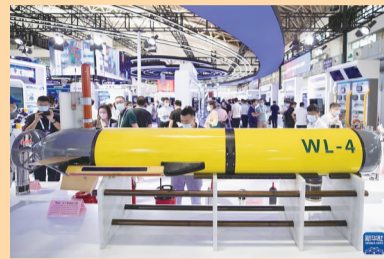
日前,2022世界5G大会在黑龙省哈尔滨市开幕。大会以“筑5G生态,促共创共利”为主题,旨在汇聚世界5G发展的最新成果,为构建全方位、多领域、深层次的全球科技和产业合作体系描绘蓝图。图为人们在2022世界5G大会的5G+海洋装备展区参观。