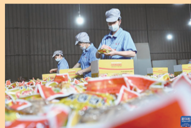
近年来,福建省建瓯市立足茶叶生产、蔬菜种植、笋竹加工等传统农业优势,大力发展设施农业,引进新品种,按照绿色生态化、基地规模化、品牌效益化的目标,大力发展特色农业,持续推进农业特色产业健康发展。图为当地合作社工人在包装竹笋加工产品。