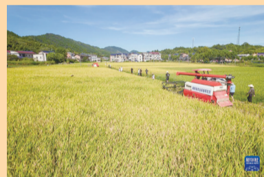
近日,湖南省农学会组织专家对位于湖南省长沙市宁乡市流沙河镇的“一季杂交稻+再生稻”生产模式宁乡示范基地的头季稻进行测产验收,经专家组现场测算,该基地头季稻亩产765.7公斤。