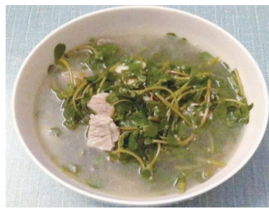
材料:猪瘦肉、马齿苋、大蒜、适量淀粉、食用油、酱油、盐

做法: 1.猪瘦肉洗净、切丝,用酱油、淀粉等调味料腌制半小时备用; 2.马齿苋择洗干净,切成段,大蒜洗净捣成蒜泥; 3.锅内放油,烧热,爆香蒜泥,加入适量清水,放入马齿苋,煮至六成熟; 4.加入肉丝继续煮,煮熟后用少许盐调味后即可出锅。