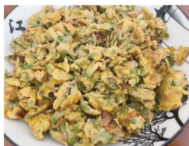
材料:刺槐花、鸡蛋、青椒、红椒、葱花、食用油、盐、生抽、蚝油、鸡精、姜丝

做法: 1.刺槐花清洗后用盐水浸泡20分钟,冲洗干净,沥干水分,青椒、红椒和姜切丝,香葱切碎备用; 2.锅中放水烧熟,将刺槐花焯水后晾干,把3个鸡蛋打破放入碗中,加入盐,把刺槐花和鸡蛋搅拌均匀; 3.锅中放油,油热放入青椒丝、红椒丝和姜丝; 4.倒入刺槐花鸡蛋液一起翻炒,加入生抽、蚝油等调味料,直至炒出香味出锅。