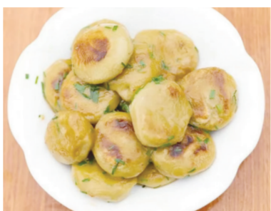
材料:丝棉草、糯米粉、葱、油 做法: 1.田野里采摘丝棉草,把丝棉草

择嫩叶、洗净、春碎、取汁; 2.丝棉草汁与糯米粉搅拌均匀,揉成面团,醒面15至30分钟左右,捏成小团子,用擀面杖压扁成饼状; 3.锅中放油烧热,把仙姑饼放入锅中煎至两面金黄; 4.最后撒上葱花、调味料,搅拌均匀后出锅。