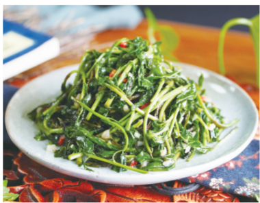
材料:枸杞芽、盐、糖、鸡精、生抽、大蒜

做法: 1.选用嫩枸杞芽,择洗干净后,放入淡盐水中浸泡5分钟,捞出沥干水分,大蒜切片备用; 2.取一口干净的炒锅,锅内加入适量油,等油热到六七成时,将洗净的枸杞芽倒入锅中进行翻炒; 3.等到枸杞芽变色、变软后加入少许枸杞,翻炒均匀; 4.加入适量的盐、糖、鸡精等调味料,翻炒至出汤汁即可。