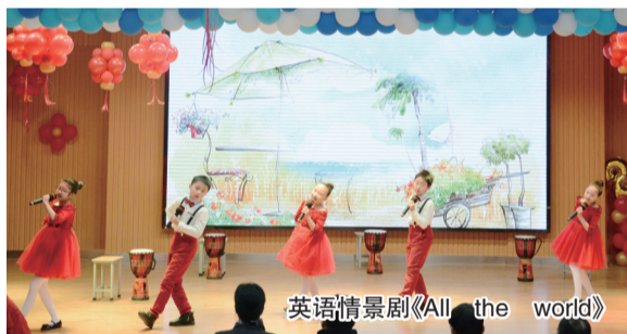
英语情景剧《All the world》

本学期,东桥小学凤凰园校区提出以“感受美、认识美、欣赏美、表现美,培养高尚情操、审美情趣和积极的人生态度”为价值取向的校本课程核心理念,将原有的学生社团活动升级为“审美人生教育校本课程”。该课程包括“美在游戏中”“美在体健中”“美在生活中”“美在艺术中”“美在逐梦中”5个主题和60个项目。