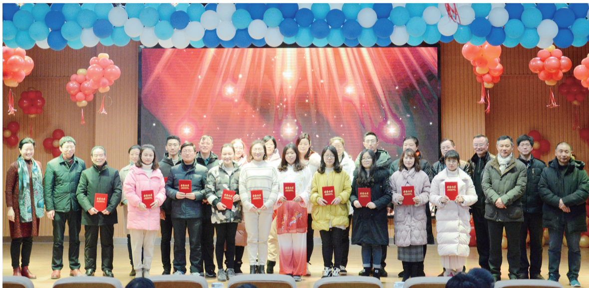
优秀校本课程老师接受表彰