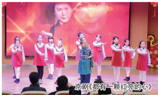
京剧《都有一颗红亮的心》