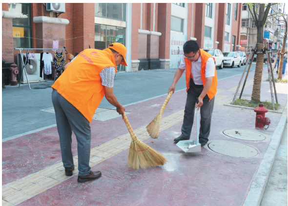
工作人员为文明城市创建贡献力量