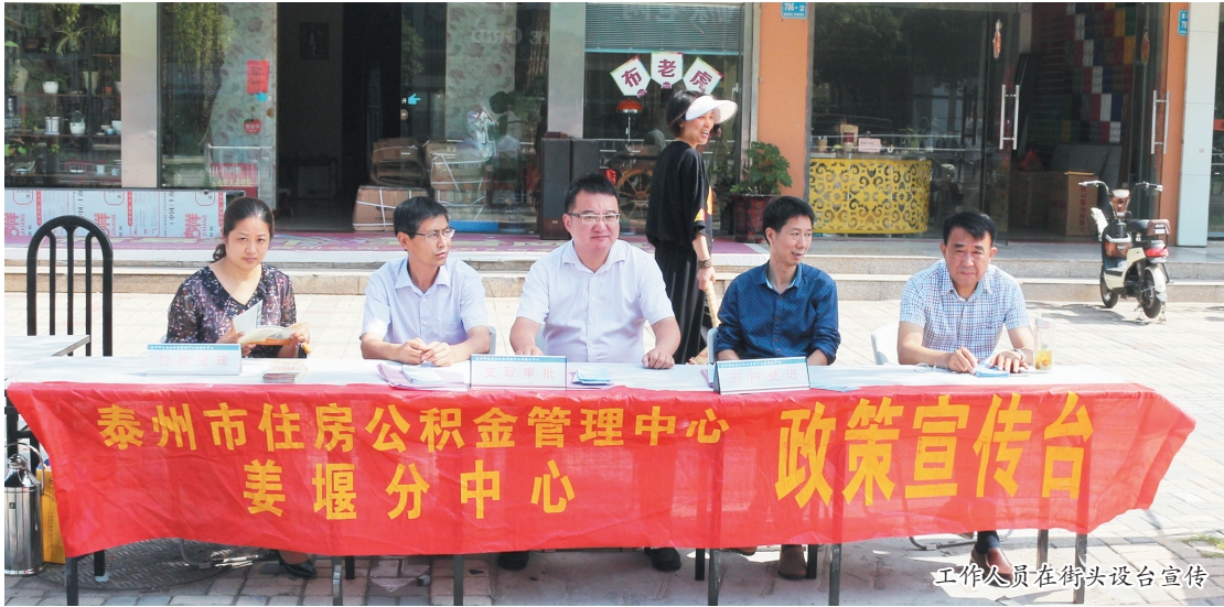
工作人员在街头设台宣传