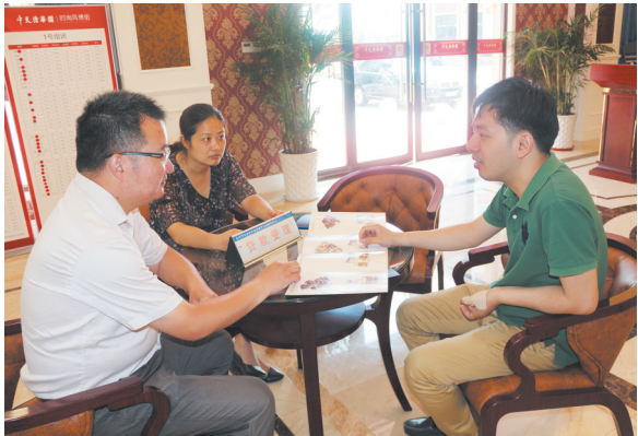
工作人员在中天清华园售楼处