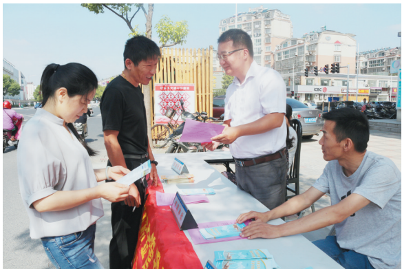
市民街头咨询住房公积金相关政策