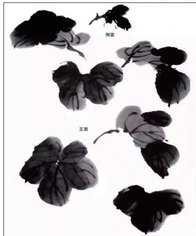
丝瓜叶子各种形态图示

三五笔画出叶子,待半干时以行草笔法勾叶筋,中锋为宜,下笔前要做到胸有成竹,注意笔尖墨与水分控制。