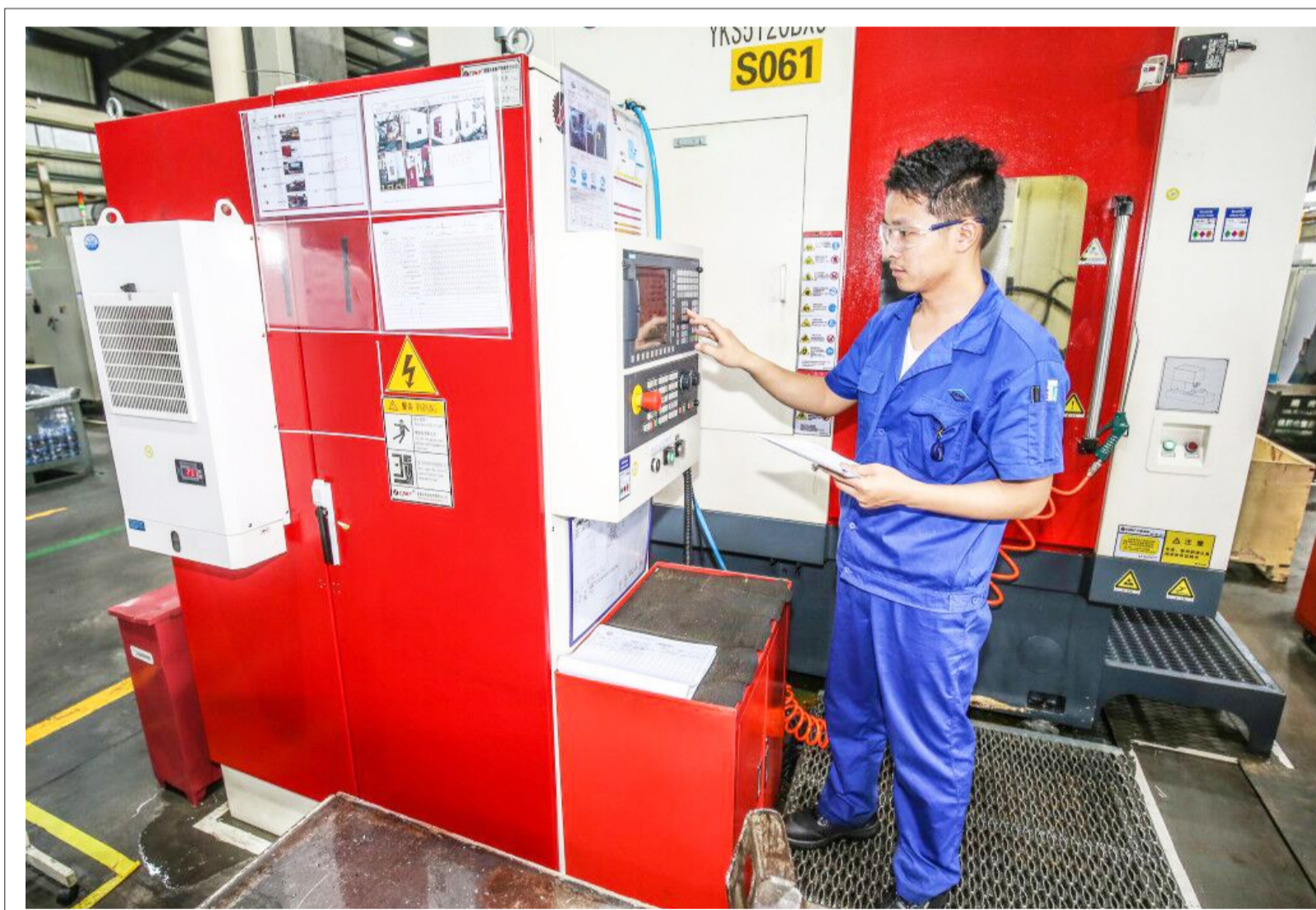
德纳非公路事业部盐城工厂隶属于美国德纳公司，主要生产静液压驱动装置及机械传动装置。今年以来，该公司在注重产品质量的同时抢抓市场机遇，进一步扩大业务范围，计划在未来5年内，持续投资3000万美金扩建新产线，全面提升企业竞争优势，1至6月份实现销售额3亿元。图为工人输入技术参数。