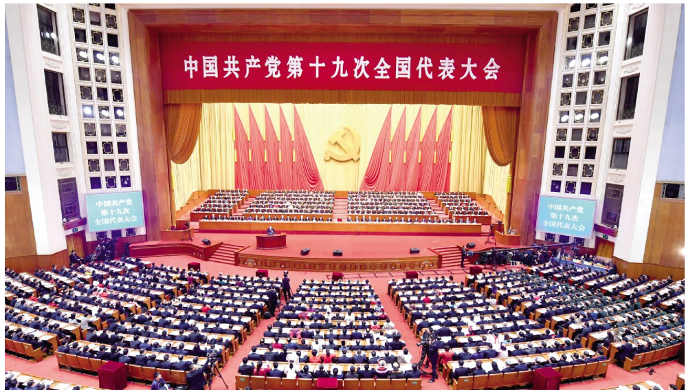
10月18日,中国共产党第十九次全国代表大会在北京人民大会堂开幕。习近平代表第十八届中央委员会向大会作报告。

新华社北京10月18日电 绘就伟大梦想新蓝图,开启伟大事业新时代。举世瞩目的中国共产党第十九次全国代表大会18日上午在人民大会堂开幕。 习近平代表第十八届中央委员会向大会作了题为《决胜全面建成小康社会 夺取新时代中国特色社会主义伟大胜利》的报告。习近平指出,中国共产党第十九次全国代表大会,是在全面建成小康社会决胜阶段、中国特色社会主义进入新时代的关键时期召开的一次十分重要的大会。大会的主题是:不忘初心,牢记使命,高举中国特色社会主义伟大旗帜,决胜全面建成小康社会,夺取新时代中国特色社会主义伟大胜利,为实现中华民族伟大复兴的中国梦不懈奋斗。 人民大会堂雄庄伟严,万人大礼堂气氛热烈。主席台上方悬挂着“中国共产党第十九次全国代表大会”的会标,后幕正中是镰刀和锤头组成的党徽,10面鲜艳的红旗分列两侧。二楼和三楼舞台上分别悬挂着“不忘初心,牢记使命,高举中国特色社会主义伟大旗帜,决胜全面建成小康社会,夺取新时代中国特色社会主义伟大胜利,为实现中华民族伟大复兴的中国梦不懈奋斗!”“伟大、光荣、正确的中国共产党万岁!”的横幅。 在主席台前排就座的大会主席团常务委员成员有习近平、李克强、张德江、俞正声、刘云山、王岐山、张高丽、马凯、王沪宁、刘延东、刘奇葆、许其亮、孙春兰、李建国、李源潮、汪洋、张春贤、范长龙、孟建柱、赵乐际、胡春华、栗战书、郭金龙、韩正、江泽民、胡锦涛、李鹏、朱镕基、李瑞环、吴邦国、温家宝、贾庆林、宋平、李岚清、曾庆红、吴官正、李长春、贺国强、杜青林、赵洪祝、杨晶。 大会由李克强主持。上午9时,会议开始。全场起立,高唱《中华人民共和国国歌》。随后,全体同志为毛泽东、周恩来、刘少奇、朱德、邓小平、陈云等已故老一辈无产阶级革命家和革命先烈默哀。 李克强宣布,党的十九大应出席代表2280人,特邀代表74人,共2354人,今天实到2338人。他对列席大会的党外朋友和有关方面负责同志表示热烈的欢迎。 习近平代表第十八届中央委员会向大会作的报告共分13个部分:一、过去五年的工作和历史性变革;二、新时代中国共产党的历史使命;三、新时代中国特色社会