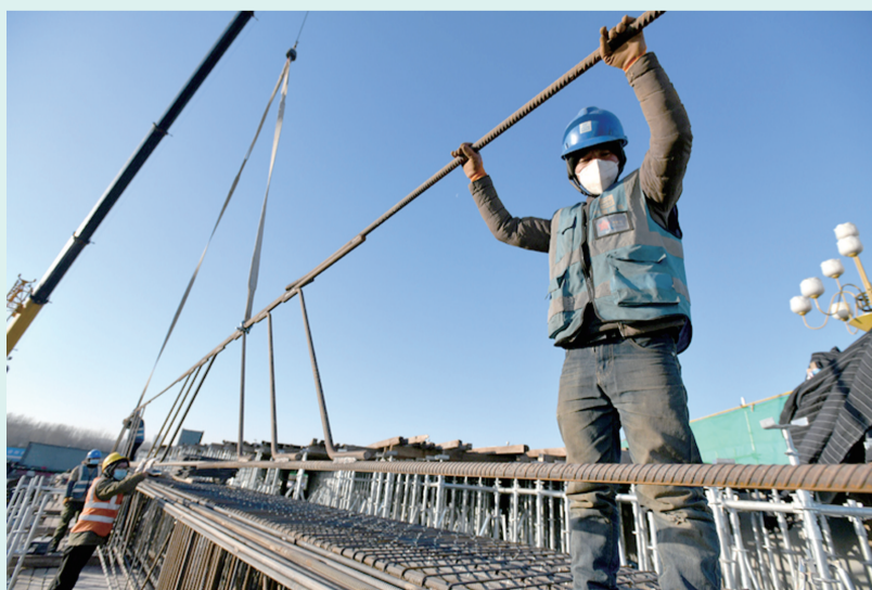
在黑龙江路跨徒骇河大桥项目现场,工人们正在加紧施工。(资料图)

截至目前,中华路道路工程(高速以南)主车道及雨污水管道完成;聊高速提升改造工程除去迁占遗留问题路段,其余基本完成。中华路跨徒骇河大桥钢塔吊装、钢箱梁焊接及现浇梁完成,济聊高速桥台墩柱、盖梁施工完成,主跨完成50%,预制梁预制完成60%;财干路东延主车道已完成,雨污水工程完成90%;绿化土方完成85%,苗木栽植完成50%;基础设施项目完成投资4.8亿元,为开发区高质量发展奠定了坚实基础。