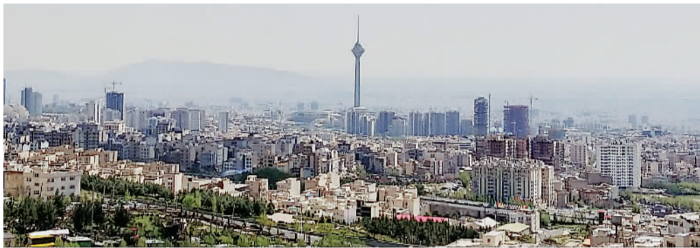
阳台上俯瞰德黑兰全城

伊朗是古丝绸之路上的重要国家，该国的主要产品丝巾、地毯的原材料，早年都是从中国通过丝绸之路运往伊朗的。加上中伊两国都有着几千年历史的文明古国，两国人民间的友谊从古丝绸之路绵延至今。笔者来到了该国，探访古丝绸之路的痕迹，感受中伊两国人民的友谊。