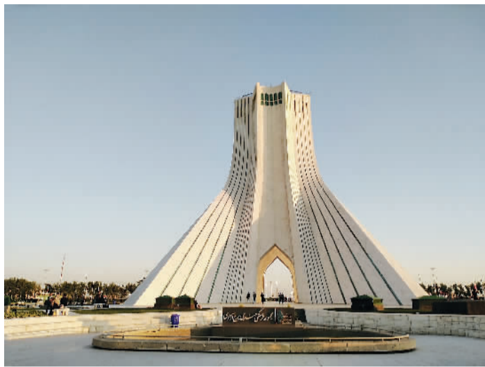
德黑兰标志性建筑