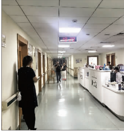
文 李秋捷 摄 朱琴

另一种情形是单位有意不注册,那么,即使劳动者和单位订立了某项契约,也不能称之为劳动合同,因为双方之间不存在劳动关系,其情形类似于个人雇佣。所谓雇佣关系,实际是一种劳务关系,是指受雇人向雇用人提供劳务,雇用人支付相应报酬形成权利义务的关系。劳动者与单位订立的合同依然有效,但是属于劳务协议,双方需要依照合同上的约定进行规范操作。