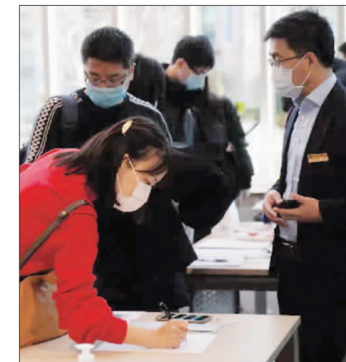
文 周斌

【点评】为贯彻落实党中央、国务院支持实体经济发展的决策部署,支持小微企业工会工作,促进小微企业健康发展,规范小微企业工会经费使用管理,2019年12月31日,中华全国总工会办公厅发出《关于实施小微企业工会经费支持政策的通知》,实施小微企业工会经费全额返还政策。根据上海市总工会要求,本市各上级工会要加强指导服务,确保小微企业工会知晓经费扶持政策,享受政策红利。